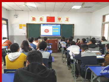
各班组织观看视频