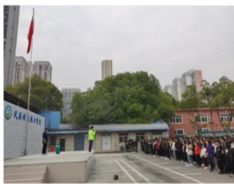
老师讲解灭火器知识

下午上课期间，随着哨声响起，演习正式开始。全校20个班级严格按照应急处置预案，各班班主任组织学生快速进入紧急疏散状态，根据演练方案设定的疏散路线紧张有序的从教室撤离到指定集合位置，及时核查人数，并向指挥部报告人员情况。短短3分钟，同学们顺利撤离到了安全地带，整个应急演练活动安全有序、规范高效，现场没有发生一例奔跑跌倒、拥挤踩踏等事故，达到了演练的预期目标。