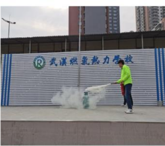
老师示范使用灭火器